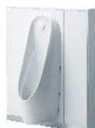
マイクロ波センサー 壁掛小便器