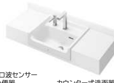
カウンター式洗面器